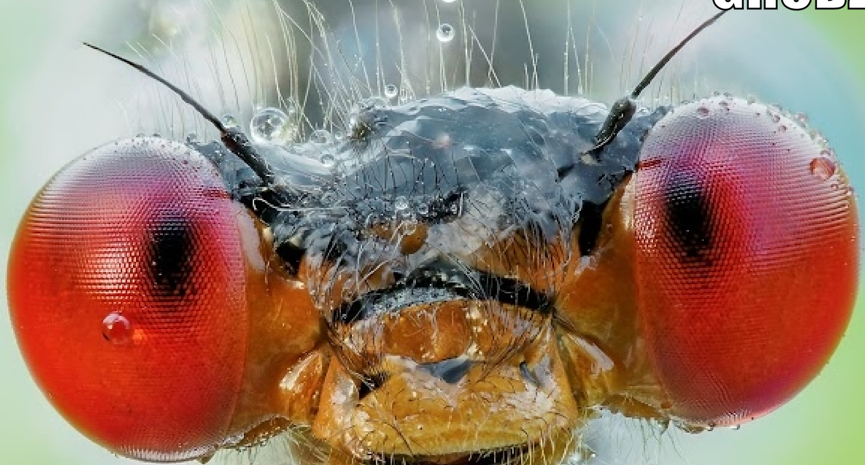
Oczobarwnica większa Erythromma najas

1 2 3 4 5 6 7 8 9 10 11 12 13 14 15 16 17 18 19 20 21 22 23 24 25 26 27 28 29 30 31