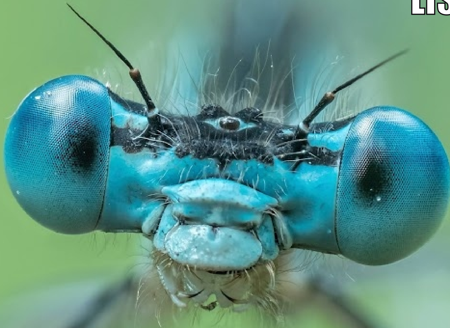
Pióronóg zwykły Platycnemis pennipes

1 2 3 4 5 6 7 8 9 10 11 12 13 14 15 16 17 18 19 20 21 22 23 24 25 26 27 28 29 30