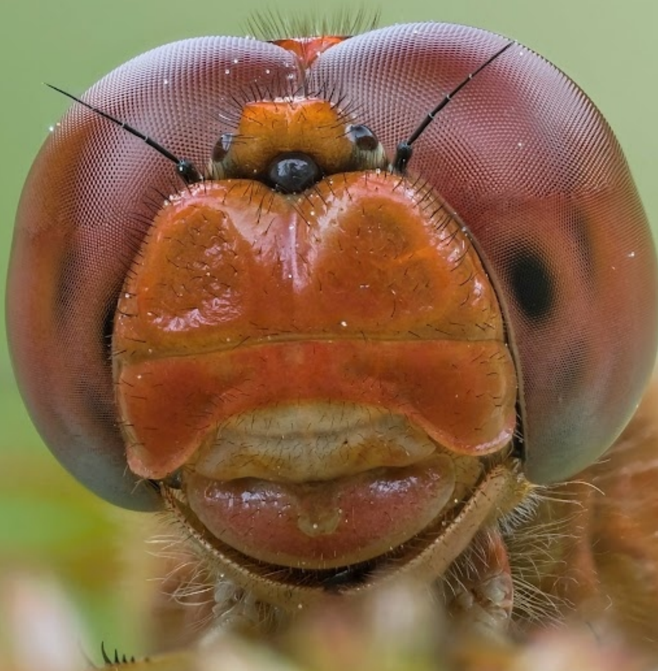
Szafranka czerwona Crocotthemis erythraea

1 2 3 4 5 6 7 8 9 10 11 12 13 14 15 16 17 18 19 20 21 22 23 24 25 26 27 28 29 30