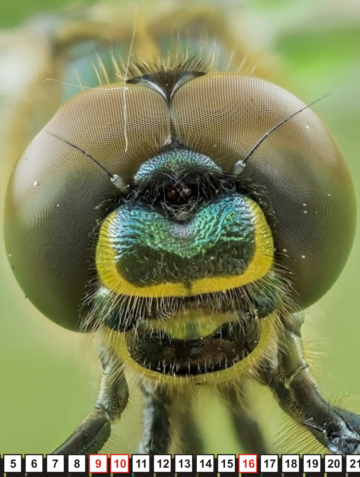
Miedziopiers metaliczna Somatochlora metallica